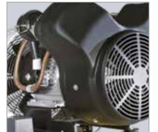
Doppelte Kühlung Hochwirksame Kühlung mit zweifachem Luftstrom.