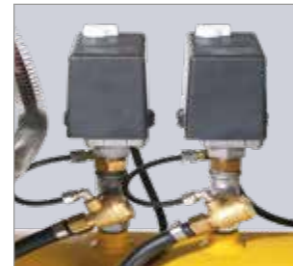
Zwei Druckschalter Entlasteter Anlauf der Kompressoren ohne Gegendruck; Ein-/Ausschaltdruck für jeden Kompressor separat einstellbar.