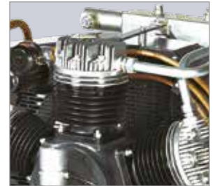
Hochwirksame Kühlung Aluminium-Zylinderköpfe mit hervorragender Wärmeabführung für längere Lebensdauer.