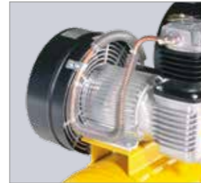
Direktgekuppeltes Aggregat Antriebsmotor direkt am Kompressorblock; robust und langlebig dank niedriger Drehzahl von nur 1500 U/min.